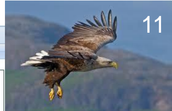
White tailed eagle Haliaeetus albicilla