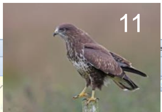
Buzzard Buteo buteo