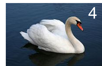
Mute swan Cygnus olor