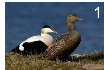
Eider Somateria mollissima