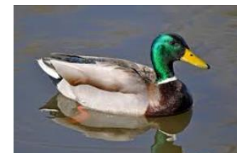
Mallard Anas platyrhynchos