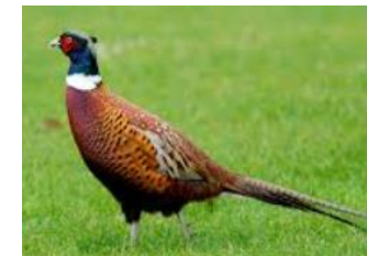
Pheasants Phasianus colchicus