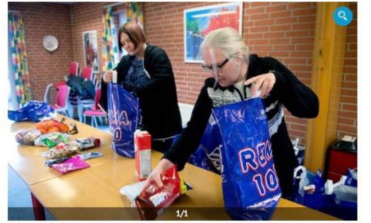
Rema1000 uddeler i julen overskydende mad til 3020 familier, der ikke har kunnet få julehjælp.

AF: JULIE MUNDELING NIELSEN JUMNI@JFMEDIER.DK Publiceret 22. december 2017 kl. 19:02