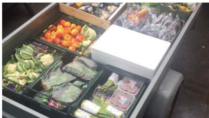
I påske organiserede en række frivillige på Bornholm også at aflevere overskudsmad fra Netto til folk, som har brug for det.

Frivillige over hele landet afleverer overskydende mad til udsatte familier for at undgå madspild.