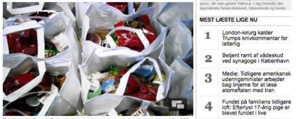
Frivillige fra Dansk Folkehjælp har i år samlet overskydende julemad fra 302 Rema 1000-butikker og delt det ud til 8365 danskere fordelt på 3020 familier.

Indsamling af overskudsmad og datokritiske fødevarer har givet julemad på bordet hos 3020 familier.