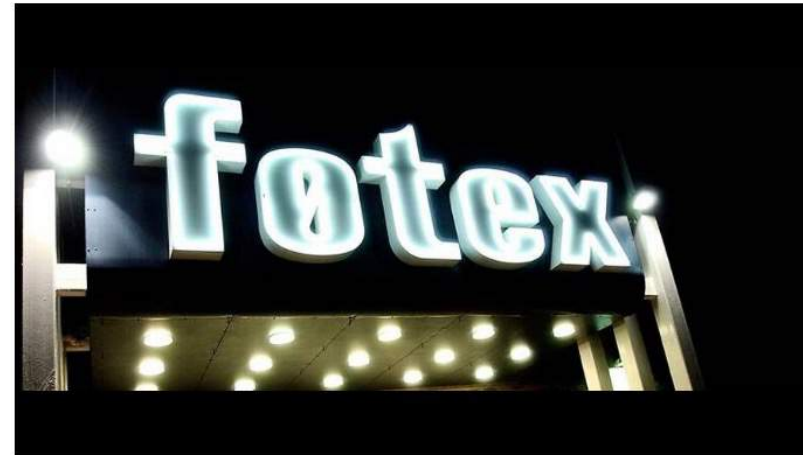
Fra at det kun skulle have været Føtex i Vanløse, voksede projektet til at omfatte 16 butikker i København, der alle leverede gratis overskudsvarer.