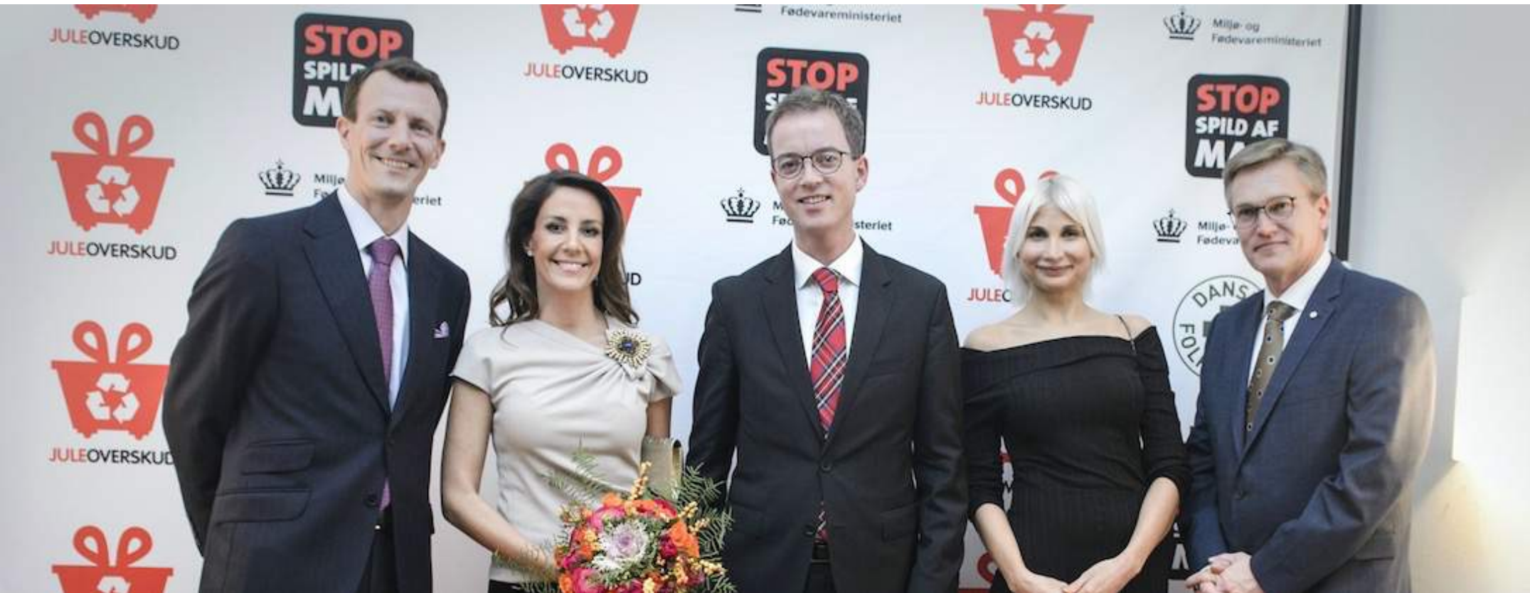
Meeting of the EU Platform on Food Losses and Food Waste Vilnius, 24 May, 2018

The initiative even got a Royal support by H.R.H. Prince Joachim of Denmark, H.R.H. Princess Marie of Denmark - and the Minister for Environment and Food of Denmark