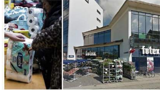
Føtex Vanløse kombinerer mindre madspild med julehjælp.

Det er stadig muligt at få hjælp til julen - Føtex i Vanløse deler ud af overskudsvarer