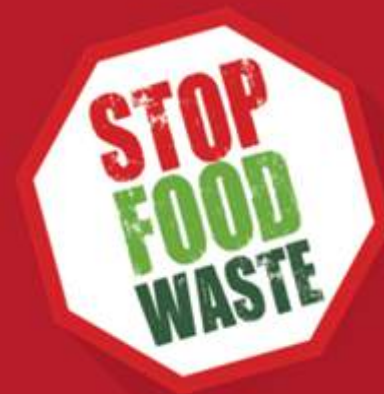
Meeting of the EU Platform on Food Losses and Food Waste Vilnius, 24 May, 2018