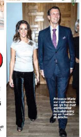
Prinsesse Marie var i velourbukser, lys top med asymmetrisk halsudklævning og en funktionel broche.

Ved store, runde borde indtog de godt 180 gæster en skøn frokosts velgørehedsmenu med tilhørende vine. Knap 200.000 kr. blev samlet ind til de værdigt trængende familier.