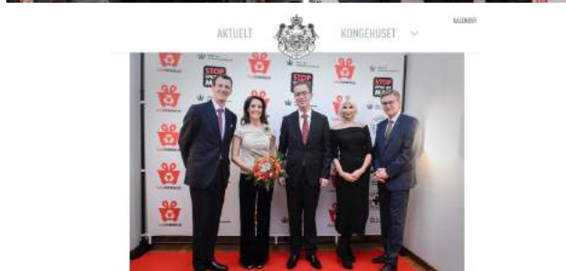
Velgørehedsmiddag med fokus på madspild