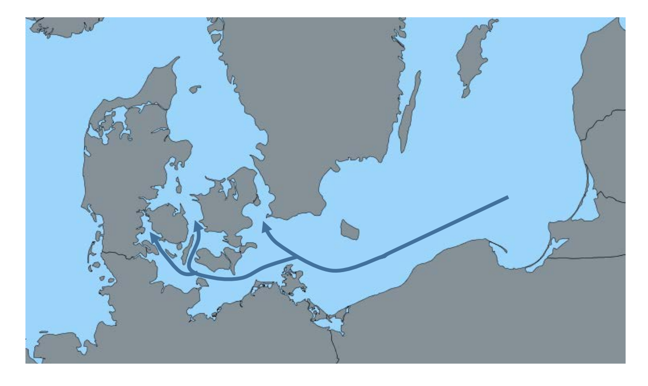
Sea currents in the Baltic Sea