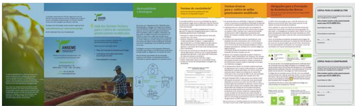
Figura 1: Desdobrável informativo aposto nas embalagens de semente de milho GM

Com o objetivo de identificar de forma inequívoca e fornecer informação sobre as normas nacionais de coexistência aos agricultores, em cada embalagem de semente das variedades de milho geneticamente modificado é aposto um desdobrável informativo, aprovado pela DGAV. Este folheto contém um resumo das regras nacionais aplicáveis ao cultivo deste tipo de variedades, informações referentes às características do OGM e um destacável que pode ser utilizado pelo agricultor para cumprimento das normas de rastreabilidade e rotulagem dos produtos obtidos (Figura 1).