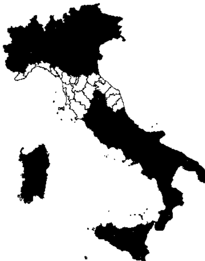
Figura 1 - Territori sottoposti a vaccinazione per la febbre catarrale degli ovini 2008

I territori soggetti a vaccinazione sono di seguito riportati e sono stati stabiliti, in conformità con il Regolamento CE 1266/2007 e successive modifiche e con i provvedimenti che si rendono necessari sulla base dell'evoluzione della situazione epidemiologica.