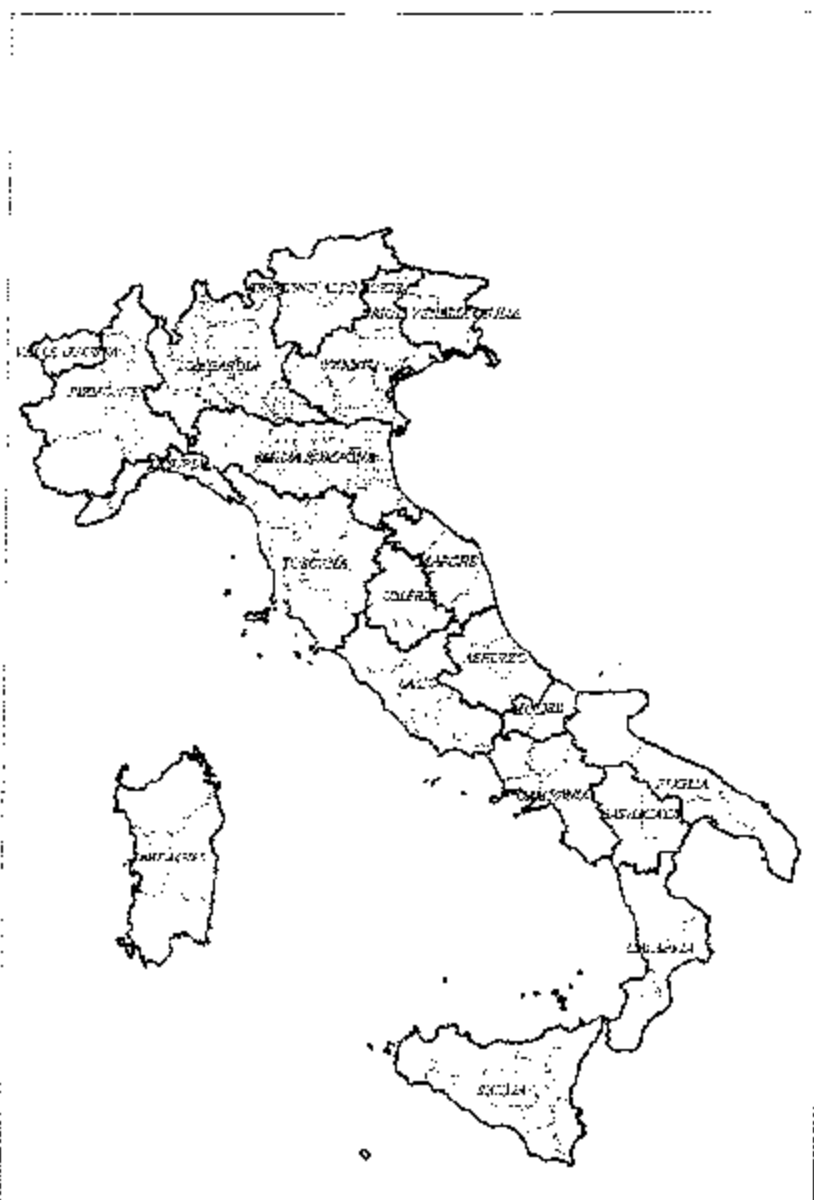
Figura 1. Zone sotto restrizione per BTV8.

In conseguenza del riscontro della positività in Provincia di Verona, sono state definite le zone di restrizione che includono le seguenti province: Belluno, Padova, Rovigo, Treviso, Venezia, Verona, Vicenza, Bergamo, Brescia, Cremona, Lecco, Lodi, Mantova, Milano, Pavia, Sondrio, Bologna, Ferrara, Modena, Parma, Piacenza, Ravenna, Reggio Emilia, Trento (Figura 1).