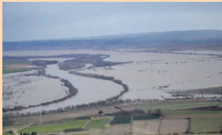
Los campos siguen anegados por el desbordamiento del río Ebro. Foto del cauce a su paso por la localidad navarra de Tudela.

Según las estimaciones de las distintas administraciones públicas, los daños totales pueden