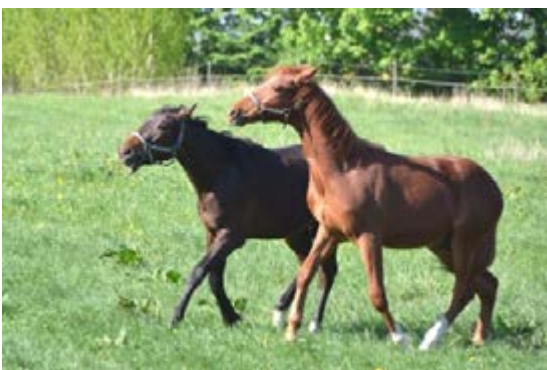
Фото 10: Соціальний контакт дуже важливий у коней

Як уже згадувалося вище, коні - це стадні тварини, і відсутність соціального контакту з іншими кіньми як на ранніх, так і пізніх стадіях життя може спричинити розвиток різних не нормальних форм поведінки та відсутність нормальної соціальної поведінки. Коні віддають перевагу повному фізичному безпосередньому контакту в загонах, на пасовищі або в груповому житті.