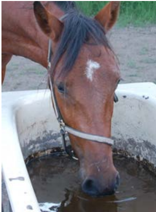
Фото 19: Коні воліють пити з відкритої водної гладі.