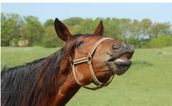
Фото3: Флемен дає можливість коням відчувати аромат уважніше

Коні – стадні тварини. У природних умовах коні живуть близько один до одного в групах. Групи, як правило, складаються з одного, а іноді й більш як з одного, дорослого жеребця та ряду кобил з потомством, враховуючи молодих самців. Молоді жеребці та старші жеребці без групи кобил також групуються разом. Група стабілізує себе за допомогою соціального порядку, що змінюється при введенні нових членів. Новий соціальний порядок, як правило, формується від кількох днів до кількох тижнів. Життя в стабільних групах має ряд переваг, передусім завдяки соціальній передачі поведінки, пошуку корму і води, та стратегії захисту з метою уникнути чи мінімізувати зустрічі з хижаками. Тому всі коні в групах рідко лягають разом. Один залишається стояти й охороняти групу. Коні, як правило, стають тривожними та невпевненими, коли їх ізолюють від інших коней. У домашніх коней відсутність соціальних контактів як на ранніх, так і на пізніх стадіях життя може спричинити розвиток такої ненормальної поведінки, як плетіння у стійлових коней або більш агресивні взаємодії на пасовищі з іншими кінями. Крім того, молодих тварин, які живуть у групах, легше навчати, ніж тих, яких утримують окремо.