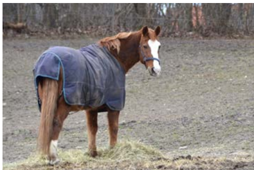
Фото 22. Кінь з водо непроникаючим килимком

У холодні зимові місяці для захисту коней від несприятливих погодних умов можна використовувати водонепроникні та повітропроникні килимки.