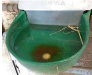
Фото 20: Слід щодня перевіряти на чистоту та функціональність.

Коням бажано мати вільний доступ до води і вони не повинні бути без води більше чотирьох годин. Це також стосується коней у загонах та на пасовищах. У зимові умови з температурою нижче нуля для цього слід вжити додаткових запобіжних заходів, наприклад, забезпечивши підігріте питтєве обладнання або регулярно подаючи рідку воду.