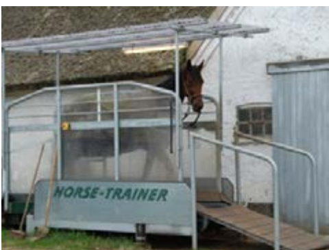
Фото 21. Коні під час вправ на біговій доріжці повинні контролювати компетентні особи.

Для тренування коней використовується таке механічне обладнання, як коні-ходунки та бігові доріжки.