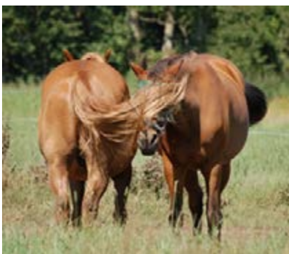
Фото 7. Коні, що стоять поруч, щоб тримати комах подалі від своїх голів.

Хоча коні є соціальними тваринами, вони мають соціальний простір, визначений відстанню, утримуваною на віддалі від інших коней. Ця дистанція індивідуальна і залежить від віку і того, наскільки добре коні знають один одного. Наприклад, під час соціального догляду відстань дорівнює нулю. Також можна спостерігати коней, які стоять близько один біля одного, намагаючись тримати комах подалі. У лощат і молодих коней, як правило, дуже вузький або менш віддалений соціальний простір: вони можуть лежати поряд. Коли коней розміщують у групах, важливо враховувати соціальний простір, вирішуючи, скільки місця їм треба відвести.