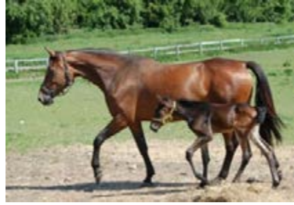
Фото 29 і 30. Лошам слід пити молозиво протягом декількох годин після народження, і їм слід давати час у загоні або на пасовищі з першого дня.

Молозиво захищає лоша від можливих збудників хвороб у навколишньому середовищі. Тому життєво важливо, щоб лоша випило молоко від кобили протягом кількох годин після народження. Якщо це неможливо, наприклад через проблему з кобилою, то слід негайно звернутися за консультацією до ветеринара.