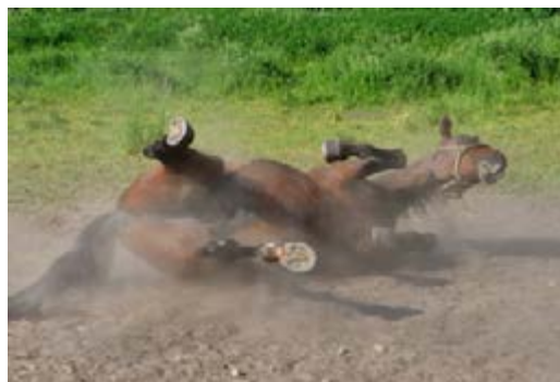
Photo 6. Rolling in sand.

Хоча коні є соціальними тваринами, вони мають соціальний простір, визначений відстанню, утримуваною на віддалі від інших коней. Ця дистанція індивідуальна і залежить від віку і того, наскільки добре коні знають один одного. Наприклад, під час соціального догляду відстань дорівнює нулю. Також можна спостерігати коней, які стоять близько один біля одного, намагаючись тримати комах подалі. У лощат і молодих коней, як правило, дуже вузький або менш віддалений соціальний простір: вони можуть лежати поряд. Коли коней розміщують у групах, важливо враховувати соціальний простір, вирішуючи, скільки місця їм треба відвести.