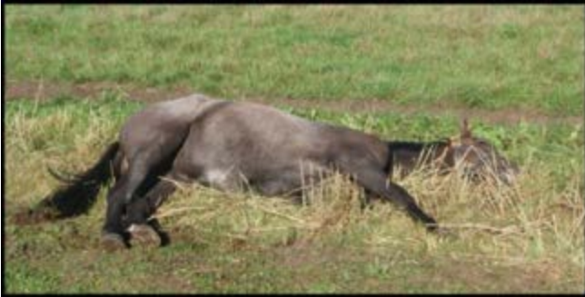
Фото 8. Коні повинні лежати рівно на боці, щоб увійти в глибокий сон. Природним положенням є витягування ніг, шиї та голови.

Коні мають різні фази сну. Зокрема, коням потрібна фаза сну протягом кожних 24 годин, коли вони лежать на боках, витягнувши кінцівки і розслабивши м'язи. Тварини повинні почуватися у безпеці, мати достатньо місця та суху зону для лежання. Важливо пам'ятати про це, підбирати розмір приміщення і тип розміщення коней.