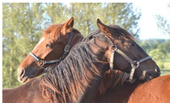
Фото 4: Взаємний догляд - пріоритена потреба щоб обмінюватися ароматом

Коні спілкуються за допомогою органів зору, звуку, нюху, постави та дотику. Наприклад, коні можуть виявляти блискавичну реакцію, досліджуючи запахи та смаки, що викликають