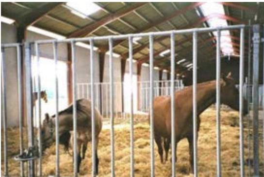
Фото 14. Коні в системі групового житла з виходом на вулицю.

У системах групового утримання загальна площа підлоги повинна забезпечувати вільне пересування, достатній доступ та простір на місцях годівлі та поїлки, а також забезпечувати суху підстилку, достатньо велику, щоб усі коні могли безперешкодно лежати одночасно. Слід враховувати фітінги, що дозволяють тимчасово прив'язувати коней, наприклад, коли подається концентрат концентрату. Слід обережно підбирати групи коней, які сумісні. Хворими або пораненими конями або конями з відхиляючою поведінкою (наприклад, агресивністю) слід керувати відповідно, і групове житло може бути непридатним для таких коней. Засоби для тимчасового відокремлення коней завжди повинні бути доступними. Конструкція системи групового житла повинна забезпечувати можливість коням віддалятися один від одного та утримувати доступ до корму та води в будь-який час. Слід уникати тупиків та гострих кутів, щоб коні не потрапляли в пастку.