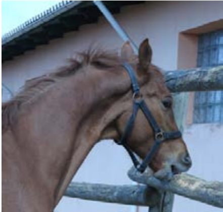
Фото 9: Кінь може кусати будь-яку поверхню.

Інші ненормальні способи поведінки можуть бути нормальними способами поведінки, які трапляються з такою не нормальною частотою, як агресивна поведінка. Розвиток ненормальної поведінки відрізняється у різних коней. Порозумінням є те, що стереотипія є заразною. Якщо коні в одній стайні розвивають однакову ненормальну поведінку, це, швидше за все, відображає те, що вони утримуються в однакових не оптимальних умовах. Крім того, споріднені коні можуть мати однакову чутливість до стресу.