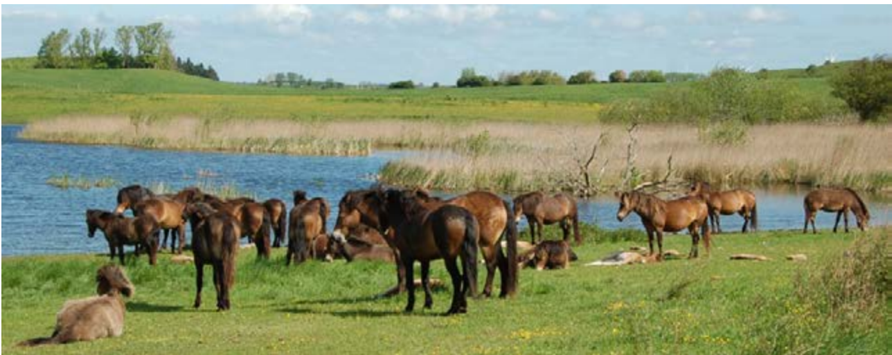
Фото 1. Знання про природну поведінку коней отримують переважно з досліджень диких коней.

Сьогодні домашній кінь, кінь Пржевальського та інші дикі чи здичавілі коні, такі як нині вимерлий тарпан, мають спільного предка. Знання про природну поведінку коней відомі частково з досліджень коней Пржевальського, повернутих до їхнього первісного середовища існування, але головним чином з досліджень диких коней - потомства врятованих домашніх коней, які живуть у природних або напівприродних умовах без будь-якого чи незначного втручання людини.