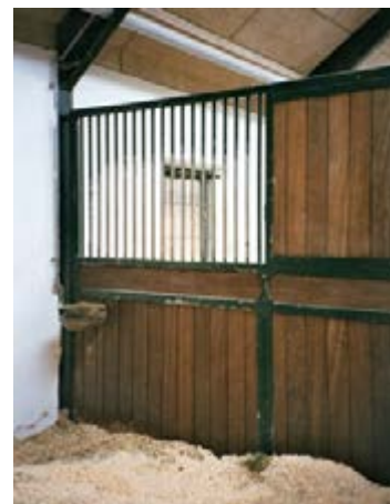
Фото 13: Індивідуальні бокси щоб коні могли бачити один одного.