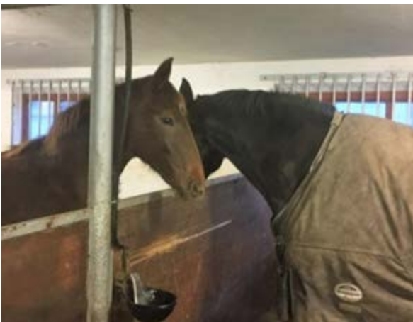
Фото 12: Відкриті індивідуальні бокси, щоб коні могли торкатися одне до одного

Індивідуальні (вільні) бокси повинні бути відповідні до розміру коня, щоб кінь міг лягти в природному боковому положенні (див. Фото 8), обернутися і безперешкодно встати та стати в природному положенні. Бокси для маленьких коників або бокси для кобили з лошам - повинні бути більшими, ніж бокси для одиноких коней. При розгляді потреб у просторі слід враховувати час, який кінь проводить у боксі. Бокс повинен бути більшим, якщо кінь стабільно стоїть протягом більшої частини дня. Верхня частина перегородок між боксами не повинна бути твердою, але дозволяти коням у сусідніх боксах бачити один одного і забезпечувати належну вентиляцію. Фітинги, такі як обладнання для годування та поїння, слід розташовувати, проектувати та підтримувати таким чином, щоб уникнути травмування коня та, наскільки це можливо, уникати забруднення сечею та фекаліями.