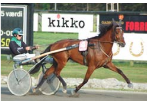
Фото 18. Деяким групом коней необхідно додавати високоенергетичні добавки до їжі.

Багато коней можуть жити на траві або грубих кормах, при необхідності доповнюючи їх вітамінами та мінералами. Деякі групи, такі як спортивні коні, молодняк, коні призначені для розмножувальних цілей, можуть мати потребу у більшому споживанні енергії через їх рівень фізичних вправ або основні потреби. Тому у них може знадобитися доповнення високоенергетичним кормом (концентратом).