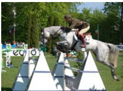
Фото 24: Скачки