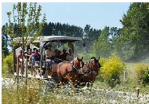
Фото 26: Віз коней, що використовуються в туризмі.

Коні використовуються в туризмі по-різному. Це може бути похід на конях, включаючи перевезення туристів до визначних місць з гідом або без нього, або в якості візних коней для проїзду туристів на оглядові екскурсії, використання як різних видів домашніх тварин тощо.