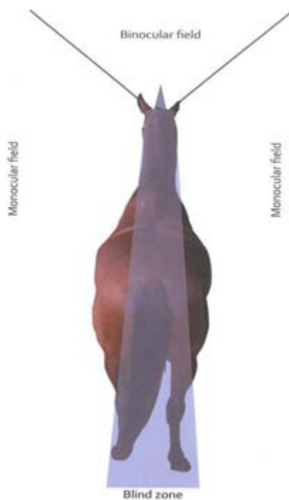
Фото 2. Поле зору коня, що показує бінокулярний зір спереду, монокулярний зір збоку та сліпу пляму позаду і під конем.

Коні мають ширококутний зір, що дозволяє їм фіксувати рухи навколо себе. Дуже важливо усвідомити, що бачення й інтерпретація візуальних образів у коней помітно відрізняються від людського сприйняття.