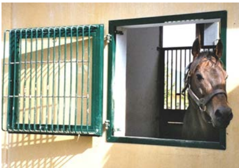
Фото 11: Вікно з ґратами

Вікна у приміщеннях для коней повинні бути зроблені з не битого скла або захищені відповідно побудованою сіткою або подібними засобами, щоб коні не розбивали скло та не травмували себе.