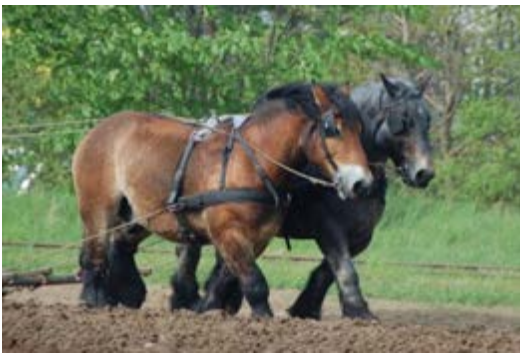
Фото 23: Робочі коні, що використовуються в сільськогосподарських цілях

Як і у будь-яких інших коней, їх основні потреби повинні бути задоволені та врахована можливість навантаження. Будь ласка, зверніться до глави 7.12 про добробут робочих коней у Кодексі здоров'я наземних тварин для детального розгляду потреб у добробуті робочих коней.