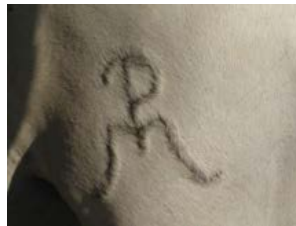
Фото 27 та 28 . Стиснення хвоста та випалювання гарячим залізом повинно бути заборонене.