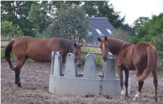
Фото 17: Коні повинні мати доступ до грубих кормів як у стійлах, так і у загонах без трави.

Жування сприяє виробленню слини, яка діє для нейтралізації безперервного вироблення кислоти в шлунку. Для запобігання виразки шлунку та зміцнення здоров'я кишечника коні залежать від майже постійного доступу до грубих кормів.