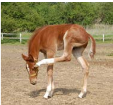
Photo 5. Scratching with a leg.

Комфортна поведінка виявляється навіть у коней, які регулярно доглядають за собою або перебувають під опікою конярів. Реакція на свербіж шкіри, видалення комах, підтримання шерсті в хорошому стані – це звичні для тварин рухи. Комфортна поведінка передбачає покусування зубів, подряпини ногою (зазвичай задньою ногою), тертя об предмет, катання в піску, бруді, снігу тощо, а також соціальний догляд, коли два коні доглядають один одного (як правило, в холці або ззаду).